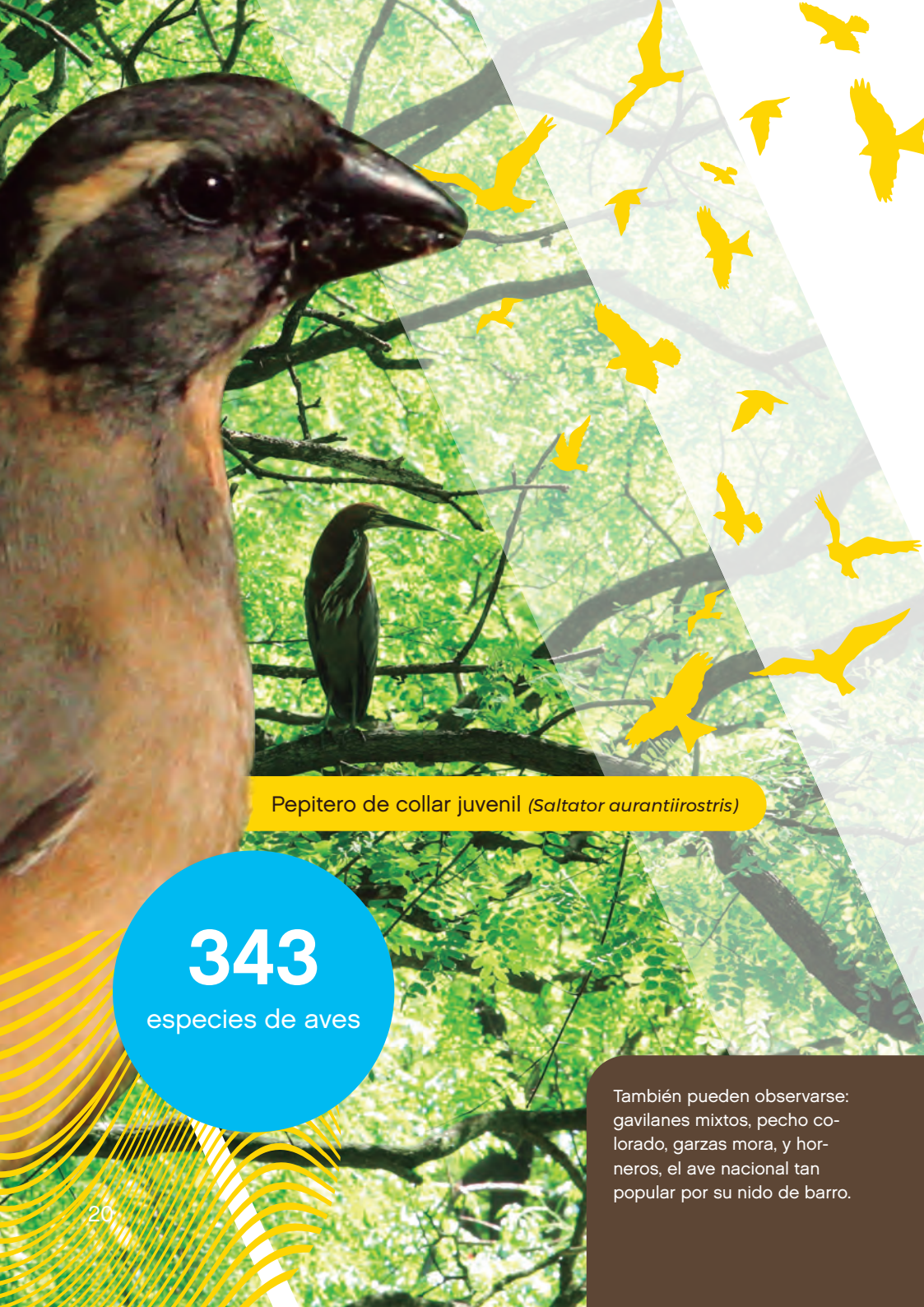
Pepitero de collar juvenil ( Saltator aurantirostris )