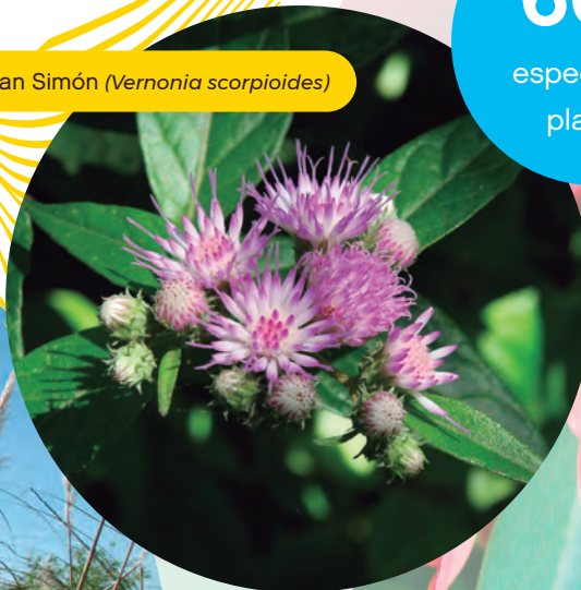
Hierba de San Simón ( Vernonia scorpioides )

Si vas a recorrer la Reserva en verano, no podés dejar de acercarte a alguna laguna para ver las totoras. Son plantas que producen enormes cantidades de pequeñas flores color rojizo-marrón. Sus hojas suelen ser utilizadas como material para tejer sillas o canastos. En el Delta del Tigre -y su emblemático Puerto de Frutos-, a pocos minutos de la Reserva, podás encontrar artesanías realizadas con este tipo de material.