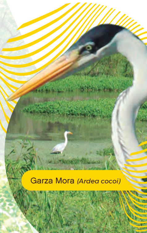
Garza Mora ( Ardea cocoi )