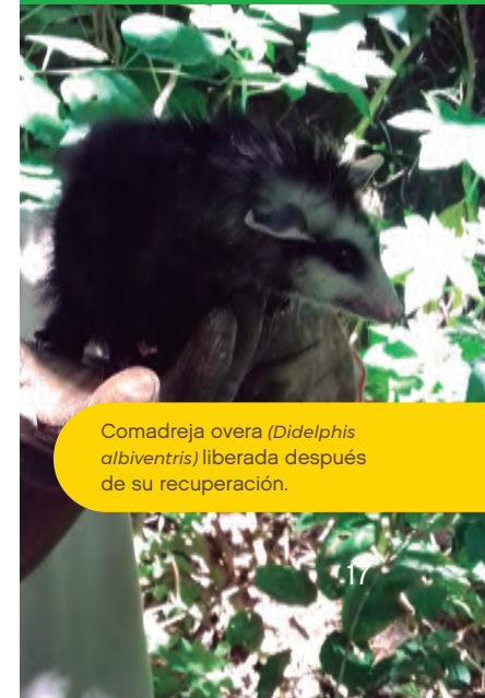
Comadreja overa ( Didelphis albiventris ) liberada después de su recuperación.

¿Sabías que en la Reserva funciona un Centro de Rescate de Fauna Silvestre? Los animales silvestres nativos encontrados en la vía pública con alguna patología física o comportamental son rehabilitados adecuadamente por un equipo de técnicos especialistas y veterinarios. Las patologías que suelen presentar van desde fracturas a intoxicaciones, así como problemáticas propias del cautiverio. Es importante recalcar que el masotismo es una práctica que sólo se puede realizar con animales domésticos.